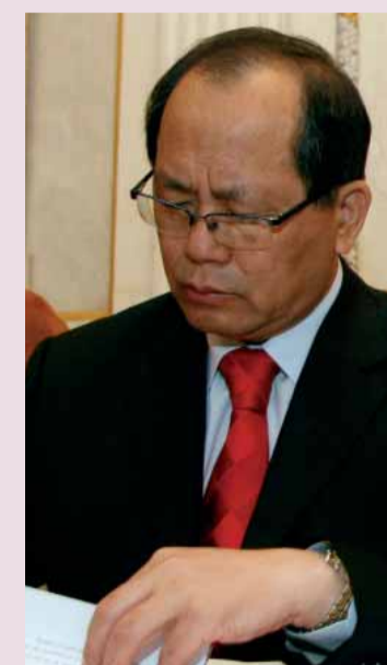
Qui Xiao Qi, ambaixador de Xina a Espanya.

■ A Xangai es va celebrar el II Fòrum Universitari Hispano-Xinès, amb la presència de rectors d'ambdós països