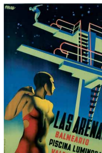
Cartell de Josep Renau.

El congrés és convalidable per tres crèdits de lliure elecció. Ja està obert el termini d'inscripció a través de l'adreça electrònica http://www.uv.es/valencia1937-2007 . Les places estan limitades a