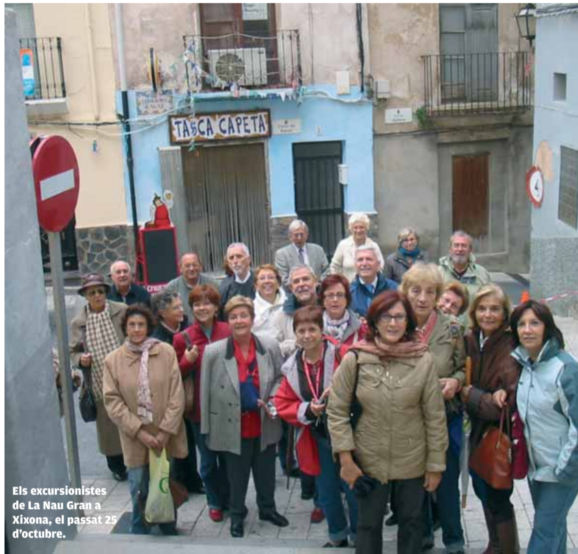
Els excursionistes de La Nau Gran a Xixona, el passat 25 d'octubre.