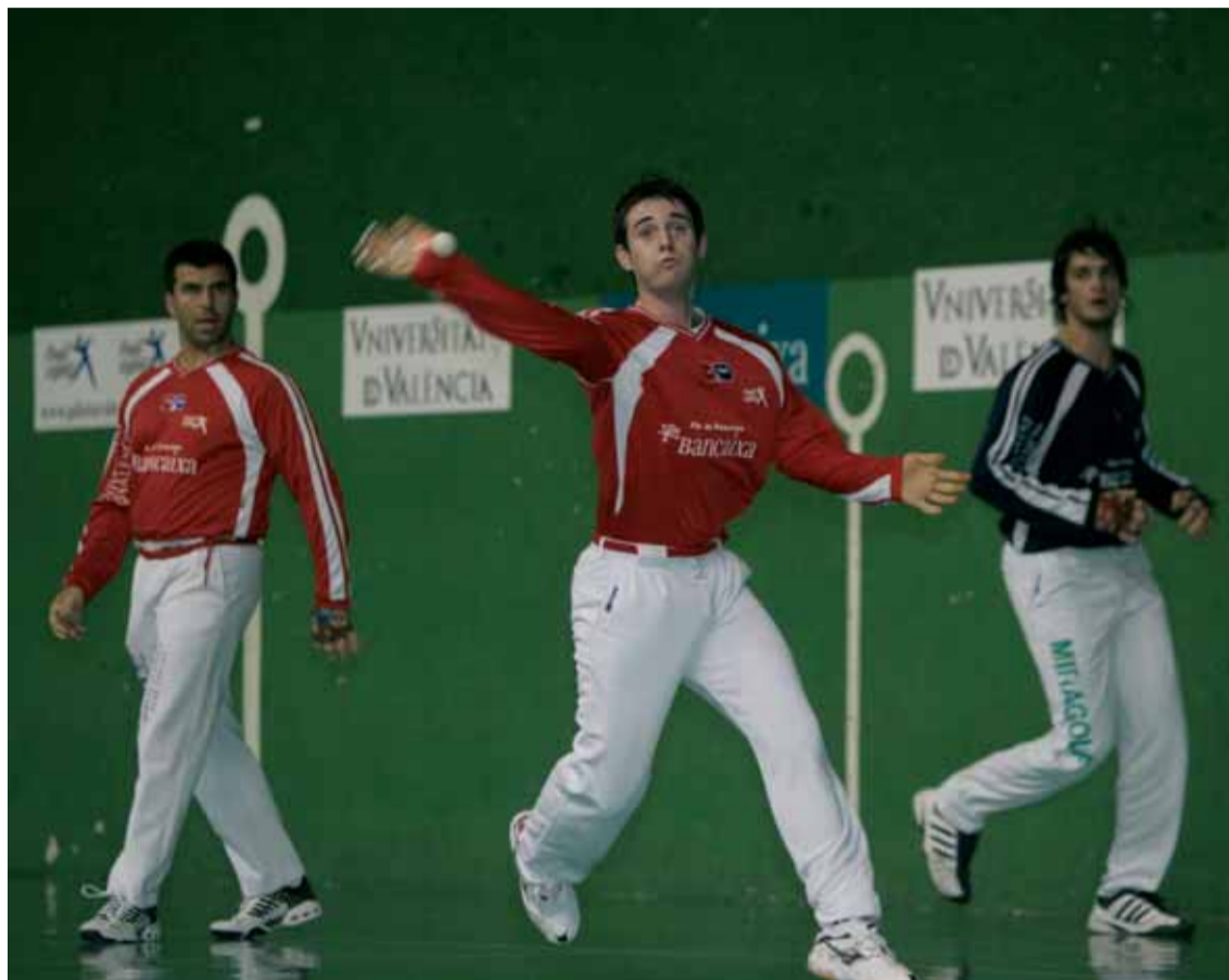
Un moment de la partida jugada al frontó del Pavelló Esportiu de la Universitat.

El frontó del pavelló estava de gom a gom, atés l'interès de la par-