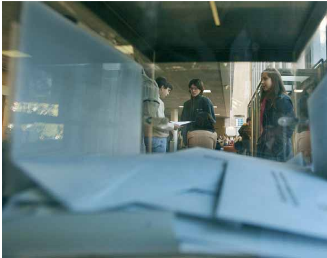
Paperetes en una urna d'una anterior convocatòria electoral.

La Junta Electoral ja ha fet pública la distribució d'estudiants claustrals per centres. Per a l'elaboració d'aquesta distribució s'ha treballat amb les dades de la matrícula de grau amb data de 31 d'octubre del 2007; amb data de 5 de novembre per a la matrícula de postgrau-doctorat; i amb data de 7 de novembre per als postgrau-màsters oficials. D'aquesta manera els estudiants