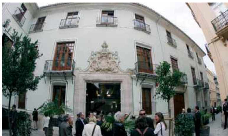
Façana rehabilitada del Palau de Cerveró.