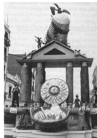
Dues falles de la dècada dels cinquanta de la comissió d'Arrancapins.