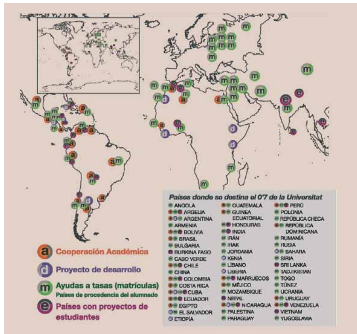
Mapa del món, en el qual s'indiquen els països on la Universitat realitza campanyes de solidaritat. Dalt, una llauradora africana, en una de les fotografies que es poden contemplar a l'edifici del Rectorat de la Universitat de València.

Els dos primers panells fan referència explícita a la cooperació de la Universitat. En el primer es presenta per primera vegada de manera gràfica un mapa del món indicant la destinació de les línies principals de la cooperació al desenvolupament de la Universitat, principalment finançades amb el programa O'7 Una Nau de Solidaritat i el O'7 de les nòmines i matrícules d'aquells universitaris que així ho desitgen. Es tracta de projectes i iniciatives de cooperació com ara la cooperació des de i entre universitats de caràcter acadèmic, els projectes de desenvolupament atenent necessitats de comunitats humanes o infraestructures, les ajudes a la formació universitària