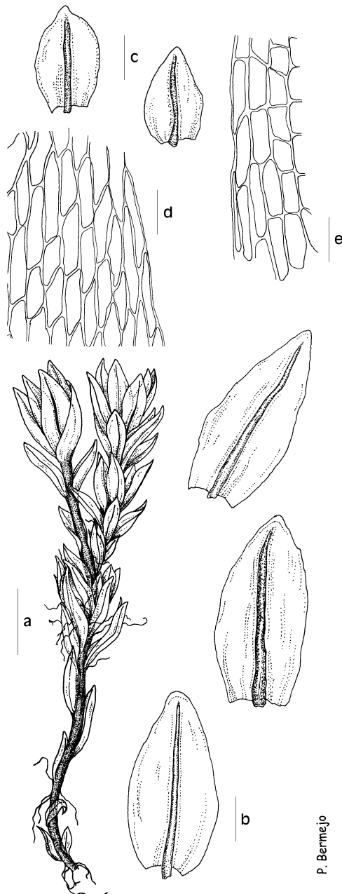
a) hábito, b) filidios superiores, c) filidios inferiores, d) células filidiales medias y marginales, e) células filidiales basales.

Musgo acrocárpico, de 0,5-1,5 cm, que crece en céspedes laxos, de un verde pálido a pardusco, ligeramente brillantes. Yemas rizoidales inexistentes. Filidios de