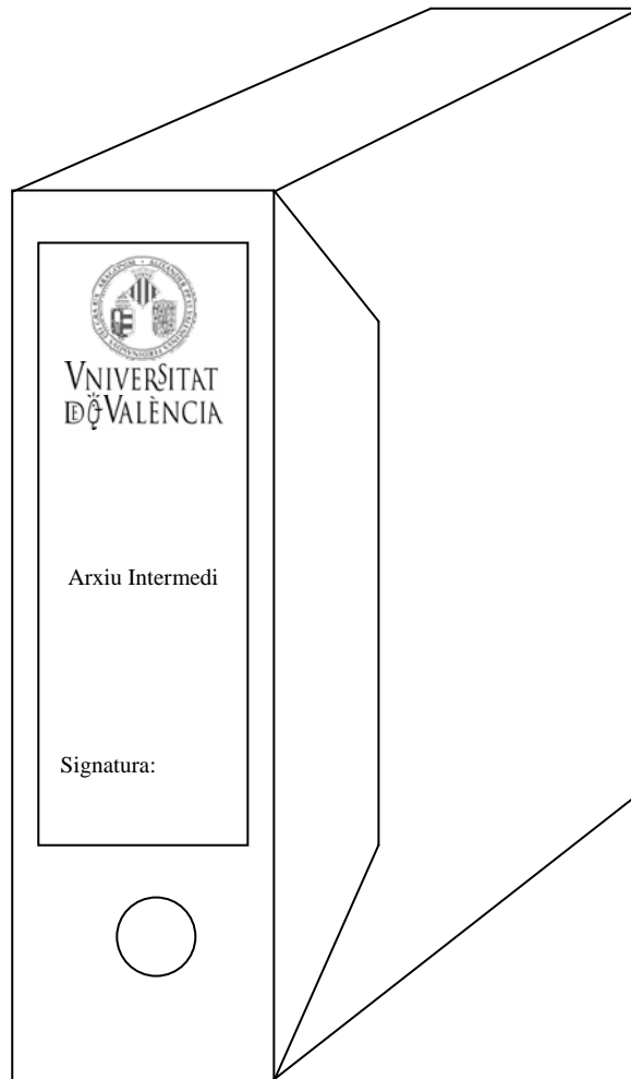
Caixa Arxiu Intermedi Tamany: foli Mesures: 360x 250 x 100