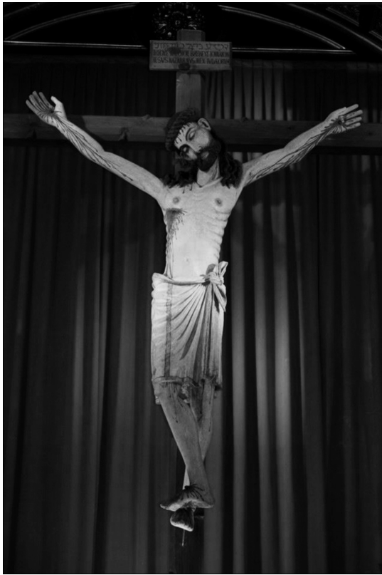
Fig. 3. Cristo del Salvador, parroquia del Salvador, Valencia, siglos XIII-XIV.

hostiga al converso. 68 Además, supuso una adaptación a través de la transferencia de acusaciones a otras religiones. Para el cristianismo y después el catolicismo los judíos fueron la raíz del herético movimiento iconoclasta, pero añadieron nuevas ramas a las que se adaptaron las narraciones sobre los anteriores. 69 Como frontera más permanente de conflicto la intensidad de las críticas se centró en musulmanes y moriscos, incluso en protestantes.