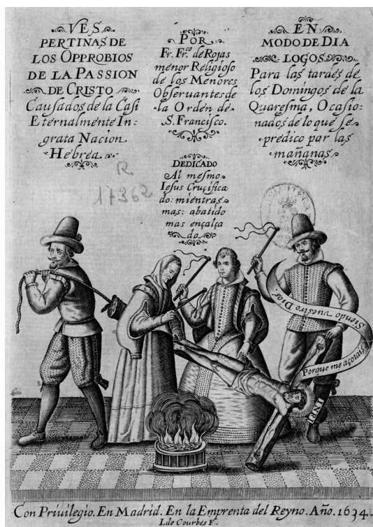
Fig. 6. Francisco de Rojas Nieto, Vespertinas de los opprobios de la Passion de Cristo causados de la casi eternamente ingrata nación hebrea, en modo de diálogos para las tardes de los domingos de la quaresma, ocasionados de lo que se predicó por las mañanas . Madrid, imprenta del Reyno, 1634.