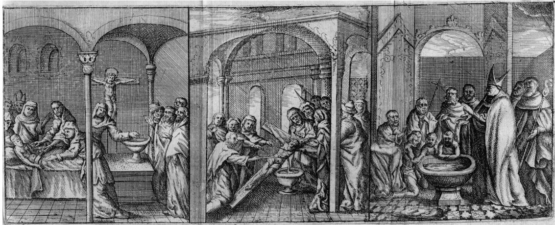
Fig. 2. Retablo de la capilla Passio Imaginis, catedral de Valencia en la obra de Juan Bautista Ballester, Identidad de la imagen del S. Christo de S. Salvador de Valencia . Valencia, Gerónimo Vilagrassa, 1672, pp. 454-455.

bautismo, como hemos visto favorecía el tema. De hecho, parece relevante en la iconografía del retablo el tamaño que ocupa el recipiente en el que se recogen los fluidos emanados, pues a diferencia de otras representaciones de este tema donde se contienen en un cáliz, con referencia a la Eucaristía y al dogma de la transustanciación, en este retablo el recipiente es una pila, por lo que se crea una relación más próxima al bautismo, una aspiración que impulsó los asaltos a juderías en 1391 y mantuvo la predicación de fray Vicente Ferrer. De hecho, con diferencia de escala la pila se repite en las tres escenas. Insiste en esta idea la representación de dos de los judíos repitiendo la acción de los soldados romanos Longinos (con lanza) y Stefatón (con caña y esponja empapada en vinagre), puesto que de los gestos que parecen guiar al primero se infiere que se sigue la leyenda medieval que aseguraba que Longinos era prácticamente ciego, y que en contacto con la sangre y el agua del Salvador que salió cuando atravesó su costado recuperó la vista y se convirtió.