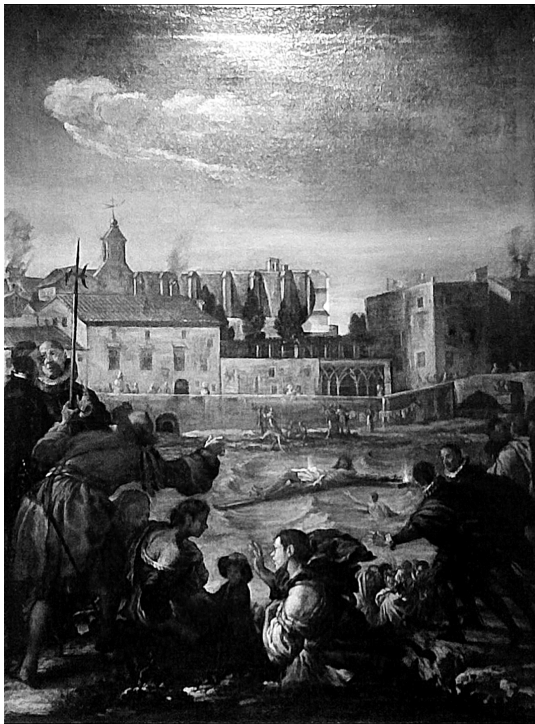
Fig. 4. Juan Conchillos Falcó (atribuida) Rescate del Cristo de Berito , de finales del siglo XVII. Museo de Klausen (Provincia de Bolzano, Italia).

los piratas berberiscos llevaron a cabo similares profanaciones en Paiporta.