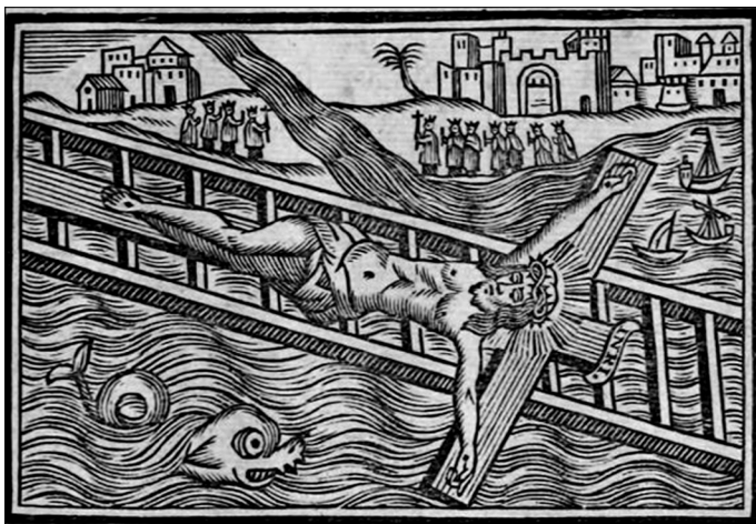
Fig. 5. Gozos del santísimo Christo del Grao, para sus Cofrades, y Devotos. Valencia, Imprenta de Joseph Estevan, entre 1773 y 1794.

1631. Ambos soportan la defensa de las imágenes y el principio horaciano en textos de la tradición cristiana, ambos defienden el uso de imágenes y ambos escriben sus obras como reacción a la destrucción de las sagradas, aunque con distinto estímulo geográfico: mientras Prades dirige sus críticas a los herejes de Francia, Alemania e Inglaterra, fray Juan Andreu de S. Joseph las dirige a los musulmanes.