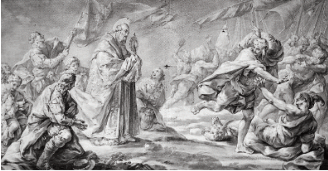
Expulsió dels moriscos. Vicent López

L'arxiu parroquial conserva el llibre de comptes de la Reforma del temple on consten els pagaments quinzenals, mensuals o bimensuals fets a Cardells entre 1960 i 1963. Tanmateix, el llibre de festes de 1960 esmenta la "inauguració de la decoració" del temple. Les quantitats entregades oscil·len entre