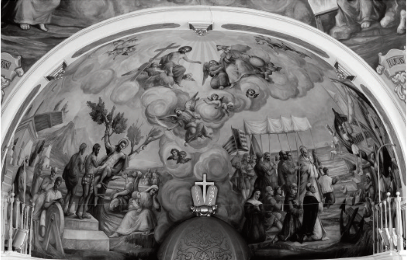
Volta del presbiteri de l'església d'Alfara

L'església de Sant Bertomeu d'Alfara del Patriarca té unes pintures murals de mitjan segle XX realitzades per l'artista de Meliana Rafael Cardells Camarlench (1899-1980). Pintor rellevant a la nostra comarca, estudià a l'Escola d'Arts i Oficis i a la de Belles Arts de Sant Carles de València, de manera que po-