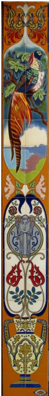
13. Brancal. Carrer de St. Bertomeu

La Mare de Déu del Carme de la façana dels Jardins Municipals al Carrer de