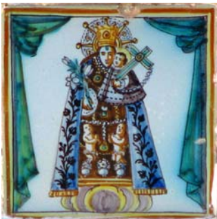
9. Mare de Déu dels Desemparats. Carrer de Cavallers

dreta amb el Xiquet al braç voltada de núvols. Porta túnica taronja, mant blau i corona. Els dos personatges estenen els braços per a mostrar els rosaris. Els òxids de cobalt i de ferro no han cuit bé al forn, de manera que trobem bombolles en el blau del mant i en la túnica taronja. Malgrat aquest xicotet defecte de cuita, el plafó té una gran vàlua. A Alfara, almenys durant el segle XIX, hi havia molta devoció a la Mare de Déu del Roser. És més, se celebrava la festivitat en octubre de manera independent a les festes patronals d'agost.