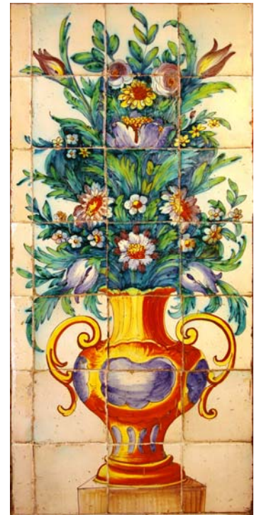
6. Socolada de l'església

Existeixen plafons molt semblants i amb la mateixa cronologia al carrer del Sol de Picanya, al carrer de Sant Josep d'Albal, al carrer de Lluís Despuig de València (desaparegut) i al carrer del Sant Crist de Senija (recompost). Les coincidències estilístiques i formals ens indiquen que tots són obra del mateix pintor o obrador valencià 3 . En els casos anteriors, a més de tindre la inscripció Santo Dios, Santo Fuerte, Santo Inmortal, líbranos, Señor, de todo mal , la composició està menys abarrotada (excepte Senija) perquè la representació ocupa més de quatre taulells i per tant no queda tant supeditada a la grandària del suport. Aquest fet no suposa de cap manera una millor qualitat respecte al plafó d'Alfara, ja que tots participen de la ingenuïtat pròpia de la ceràmica devocional de l'època.