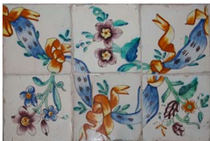
5. Socolada de l'església

Alfara posseeix un conjunt ceràmic que comprén des del segle XV fins el XX i que cal tenir en consideració pel seu interès històric, artístic, etnològic i patrimonial. Es tracta de pintura ceràmica sobre taulell amb diferents tipologies i funcions com plafons devocionals, plaques de nom de carrer, taulells de mostra per a paviments i recobriments de murs, etc.