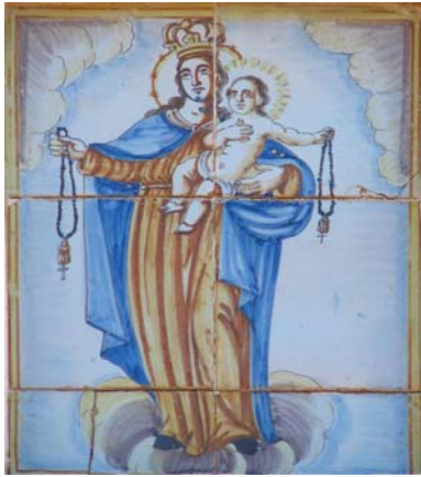
8. Mare de Déu del Roser. Carrer de Cavallers

ha variat molt poc al llarg dels anys. Així la veiem també en els goigs a Santa Bàrbara Virgen y Màrtir, venerada en la iglesia parroquial del lugar de Alfara del beato Patriarca datats en la segona dècada del segle XIX i també en la imatge processional de l'església. El dibuix amb perfilat de manganès encara s'aprecia en la major part del taulell, però ja és patent la nova manera d'entendre la pintura ceràmica que s'imposarà en el segle XIX. Ens referim a la vegetació del fons, que no ha estat dibuixada prèviament, sinó que està tractada amb xicotetes pinzellades en un intent d'aproximar-se a la pintura de cavallet. Fins i tot utilitza ja els verds de tonalitats apagades, com de fulla seca, en lloc dels colors cridaners de l'etapa rococó anterior.