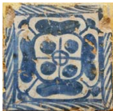
1. Taulell gòtic