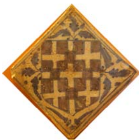
4. Escut dels Cruïlles