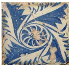
2. Taulell gòtic