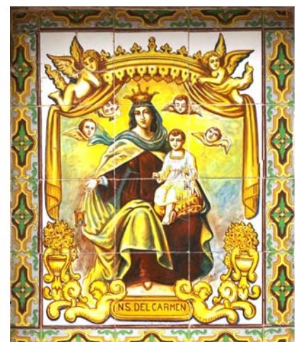
14. Mare de Déu del Carme. Carrer de St Bertomeu