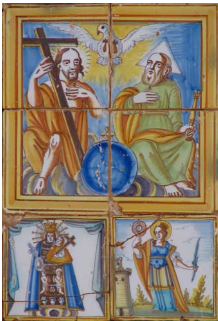
7. Trinitat. Carrer Major

La Trinitat d'Alfara mostra la iconografia més comuna en els plafons ceràmics valencians. Déu pare i Déu fill, amb edats diferents, estan asseguts sobre un tron de núvols amb l'orbe als peus. El colom de l'Esperit Sant, voltat dels raigs de la gràcia, sobrevola els caps. Déu pare té a les mans el ceptre del poder i el fill sosté la creu mentre mostra les ferides dels peus i mans. El fet que la representació estiga limitada a només quatre taulells obligà el pintor ceràmic a comprimir la composició, posant els personatges en posicions forçades i incòmodes, i encongint les anatomies.