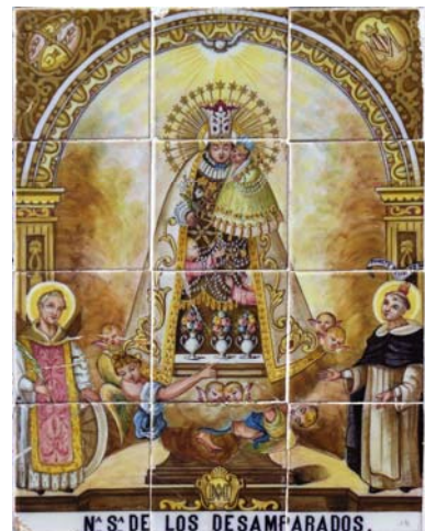
10. Mare de Déu dels Desemparats. Carrer del Mestre Palau

El plafó de la Mare de Déu dels Desemparats amb Sant Vicent Màrtir i Sant Vicent Ferrer (fig. 10) del carrer del Mestre Palau núm. 3 té la mateixa cronologia que els anteriors i també utilitza el mateix color rosat tan característic de l'època. En els carcanyols de l'arc veiem a la dreta l'escut de la ciutat de València i a l'esquerra el d'Espanya amb les armes de Castella i Lleó que es feia servir durant la monarquia de la Restauració. De fet, tres pinzellades al centre insinuen les flors de lis dels Borbons. El componen 12 taulells (4 x 3) i porta la inscripció Na Sa de los Desamparados . Està basat en l'estampa de la Mare de Déu dels Desemparats de l'Establiment litogràfic de Pere Martí de València. Al plafó s'ha substituït l'escut de la confraria per l'anagrama de Maria i s'ha afegit el filacteri del Timete Deum de St. Vicent Ferrer.