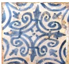
3. Taulell del s.XVI