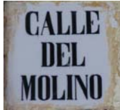
11. Retolació urbana