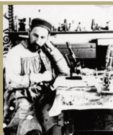
Ramon y Cajal, al laboratori de València

Va guanyar la càtedra de Anatomia Descriptiva de la Facultad de Medicina de Valencia en 1883, on va poder estudiar l'epidèmia de còlera que va patir la ciutat l'any 1885. Dos anys després, en 1887 es va traslladar a la Universitat de Barcelona. En 1888 descobreix els mecanismes que governen la morfologia i els processos conec-tius de les cèl·lules nervioses de la matèria gris del sistema nerviós central. Durant els següents dos anys va desen-tranyar els canvis bàsics que