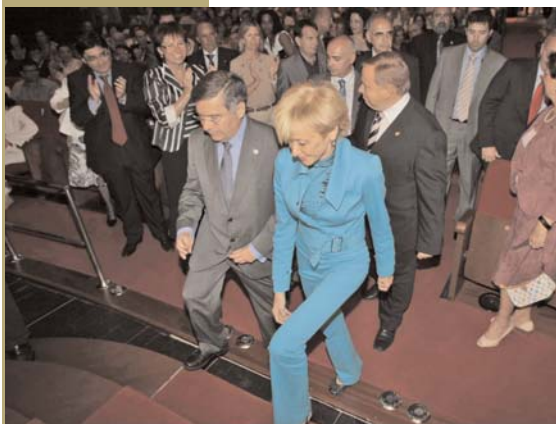
El rector i la ministra en la inauguració de la UEG