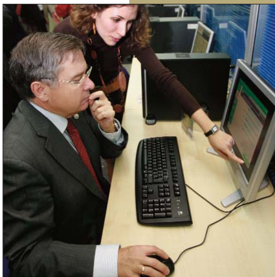
El rector Francisco Tomás en la inauguración del CAL

El Servicio de Política Lingüística contaba ya con centros de autoaprendizaje en los tres campus para el estudio del valenciano, una especie de biblioteca especializada en lengua catalana donde encontrar, además de asesoramiento y resolución de problemas tutelados por un técnico lingüístico, diccionarios, libros de texto, literatura, material audiovisual y todo lo relacionado con la enseñanza de las lenguas.