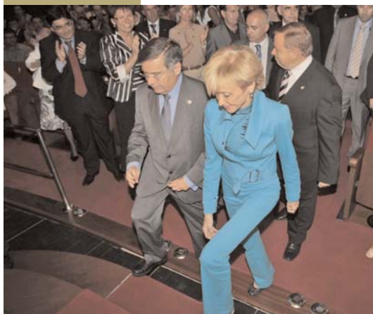
El rector i la ministra en la inauguración de la UEG