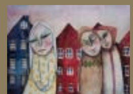
También en Copenhage tres son multitud.