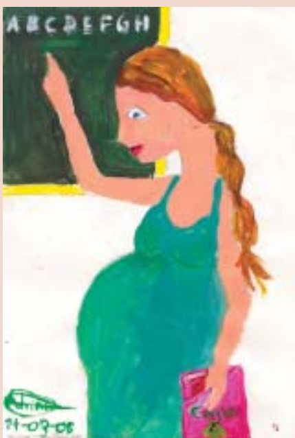
Adrián López, 9 anys

5. Suspensió del contracte de treball. Nova causa de suspensió del contracte de treball en el supòsit que el lloc de treball o les condicions de l'exercici generen riscos tant per a la dona embarassada i/o el seu futur fill o filla o repercuten negativament en l'embaràs, així com una prestació pública dins de la SS substitutiva de les rendes del treball en aquesta situació.