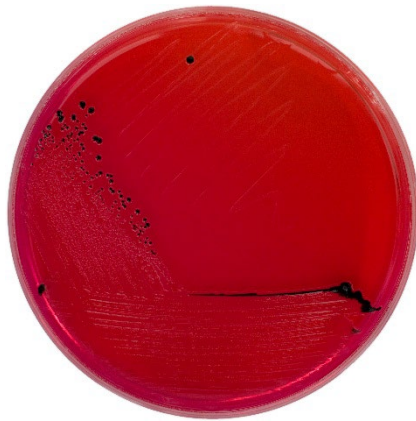
Chromogenic XLD agar Red colonies with black centres