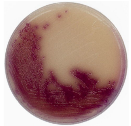
Chromogenic OSCM agar Magenta colonies