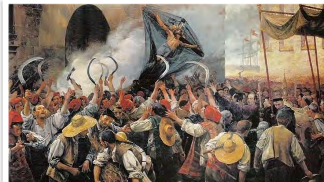
Antoni Estruch i Bros, Corpus de Sang (1907)