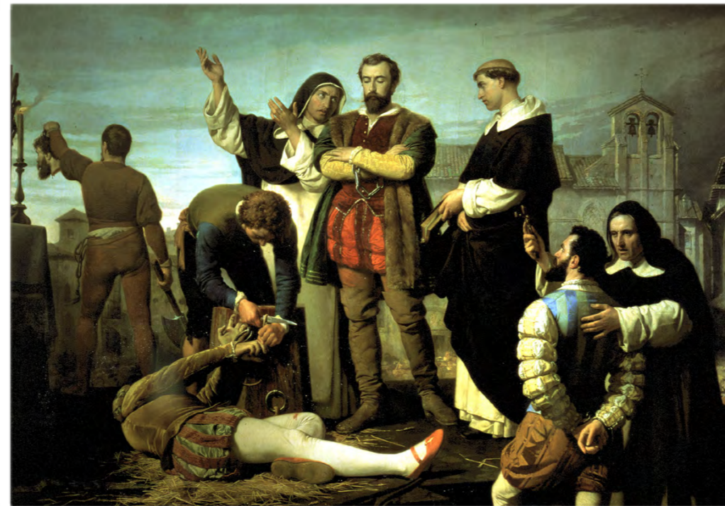
Ejecución de los comuneros de Castilla en Villalar el 24 de abril de 1521, visto por Antonio Gisbert, año 1860.