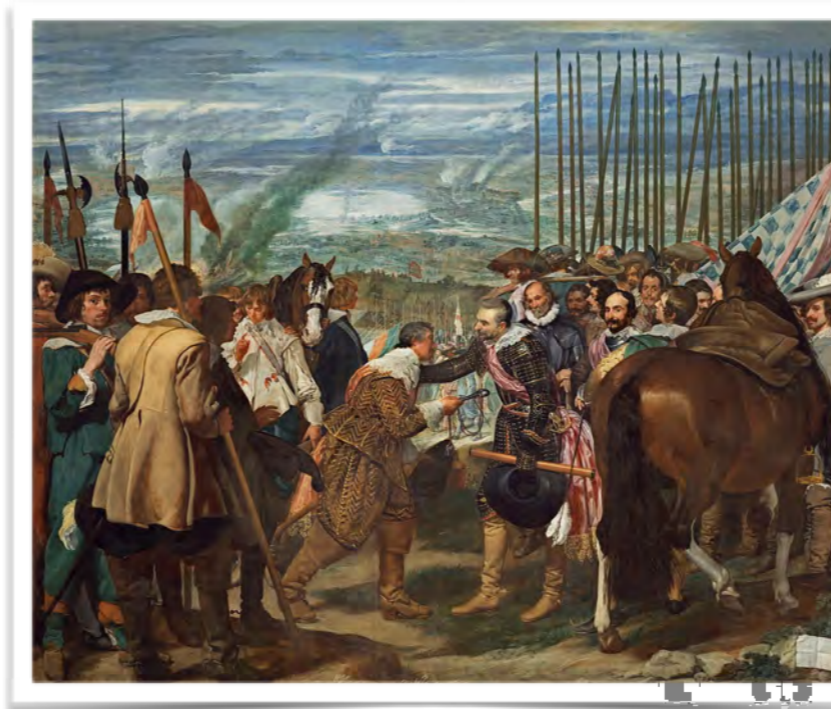
Diego Velázquez La rendición de Breda (1634)