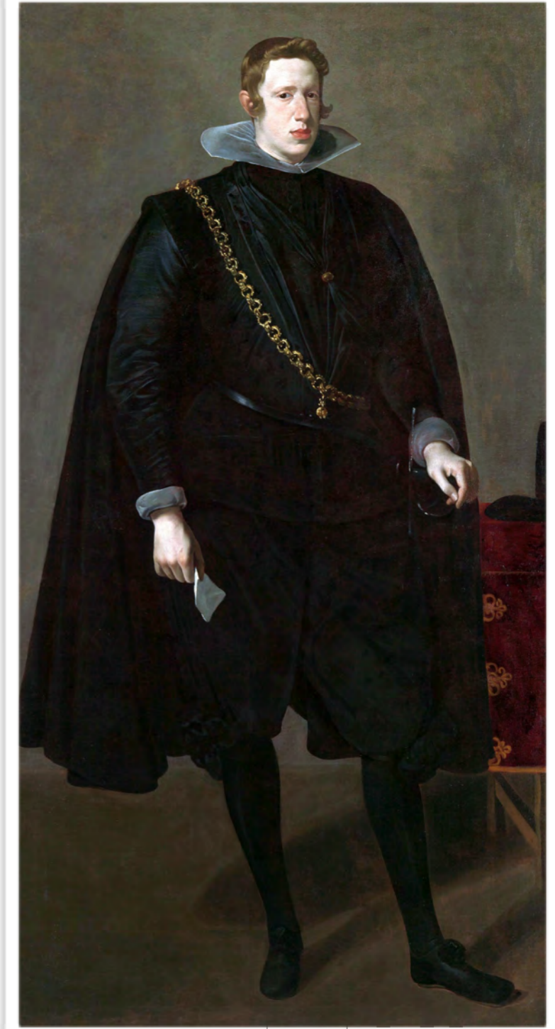
Diego Velázquez, Felipe IV (1623)

«Tres son, señor, los caminos que a V. Majd. le puede ofrecer la ocasión y la atención en esta parte y, aunque diferentes mucho, podría la disposición de V. Majd. juntarlos, y que sin parecerlo se ayudasen el uno al otro.»