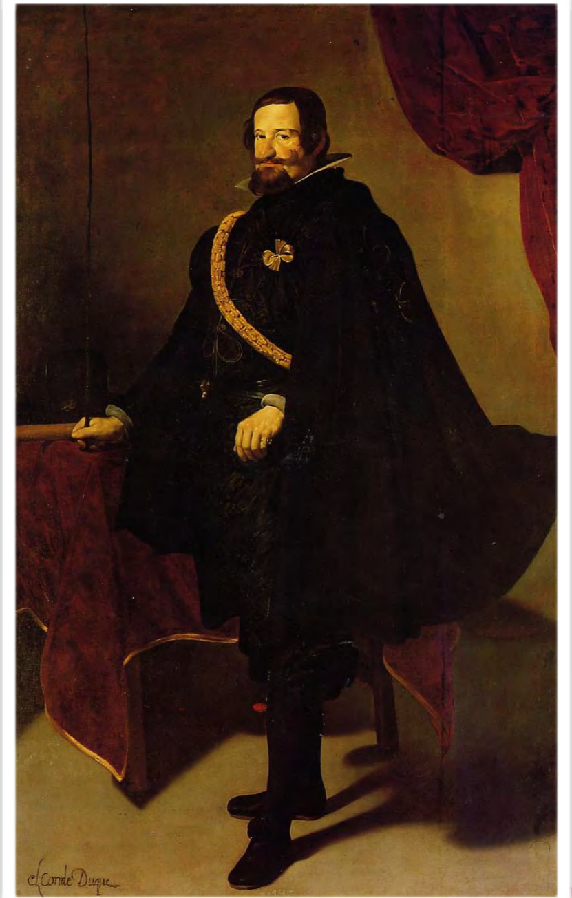
Diego Velázquez, Don Gaspar de Guzmán, conde de Olivares y duque de Sanlúcar la Mayor (c. 1622-1627)

«El tercer camino, aunque no con medio tan justificado pero el más eficaz, sería que hallándose V. Majd. con esta fuerza que dije, ir en persona como a visitar aquel reino donde se hubiere de hacer el efecto, y hacer que se ocasione algún tumulto popular grande, y con este pretexto meter la gente, y con ocasión de sosiego general y prevención de adelante, como por nueva conquista, asentar y disponer las leyes en la conformidad de las de Castilla, y desta misma manera irlo ejecutando en los otros reinos.»