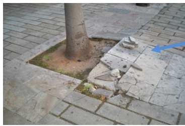
Perill de caiguda al mateix nivell