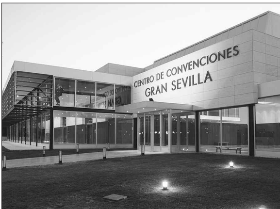
Centro de Convenciones Gran Sevilla, sede del 27º Congreso Internacional del CIRIEC.

El próximo 22 de septiembre dará comienzo en Sevilla el 27º Congreso Internacional del CIRIEC, foro de referencia sobre la economía pública, social y cooperativa, que tendrá lugar en la capital andaluza entre los días 22 a 24 de septiembre del presente año, organizado por CIRIEC-España con la colaboración de CEPES Andalucía y el patrocinio de numerosas entidades públicas y privadas. El Congreso se celebra bajo la Presidencia de Honor del Rey don Juan Carlos y con el lema “Innovación y Management: las respuestas de las empresas de economía pública, social y cooperativa a los grandes desafíos”.