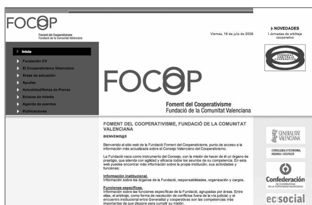
Página Web de FOCOOP, en la dirección www.focoop.es .