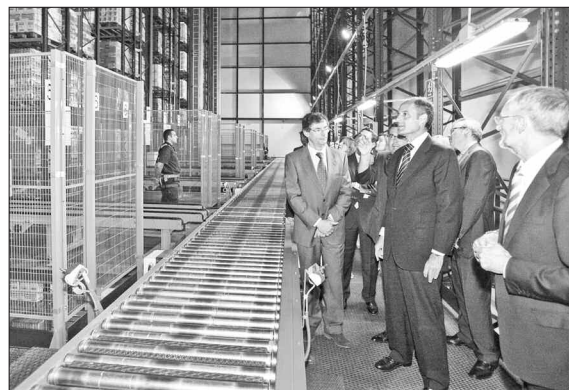
Nuevo silo de Consum.