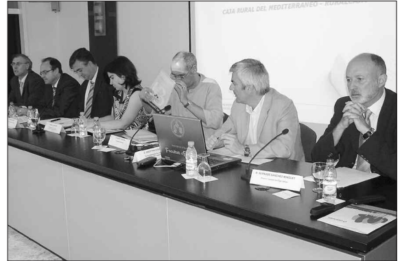
Mesa redonda sobre el papel del crédito cooperativo en la financiación de empresas de economía social.