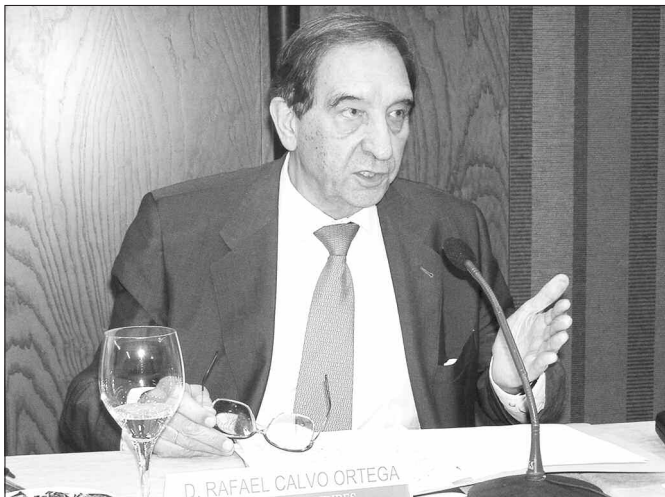
Rafael Calvo Ortega.

El pasado 20 de junio se reunió en Madrid el patronato de la Fundación Iberoamericana de la Economía Social (FUNDIBES), bajo la presidencia del ex ministro de Trabajo, Rafael Calvo Ortega. El patronato hizo un balance muy positivo de los cinco primeros años transcurridos desde la constitución de FUNDIBES, tanto por las actividades llevadas a cabo en forma de encuentros y seminarios, como por los estudios publicados, que han permitido obtener una primera visión del estado actual de la economía social en Iberoamérica.