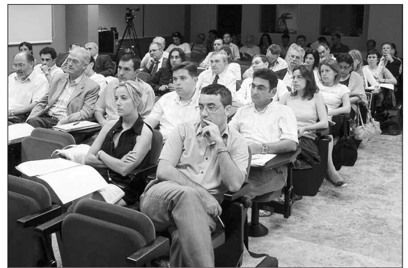
Asistentes a las jornadas del IUDESCOOP.