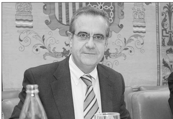
Celestino Corbacho, ministro de Trabajo e Inmigración.

El ministro de Trabajo e Inmigración, Celestino Corbacho, ha mencionado como una de las líneas prioritarias de su departamento para la presente legislatura la creación de una Ley General de Economía Social. Esta mención la realizó en su primera comparecencia en la Comisión de Trabajo e Inmigración del Congreso de los Diputados, comparecencia que tuvo lugar el pasado 26 de mayo con el fin de exponer el conjunto de las líneas maestras de la política que llevará a cabo su Ministerio en los próximos cuatro años.