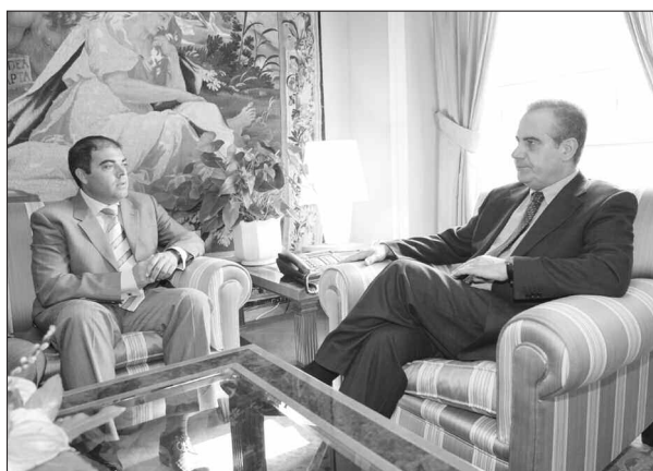
El presidente de ATA, Lorenzo Amor, se reunió en mayo con el ministro de Trabajo e Inmigración, Celestino Corbacho, a quien le trasladó la necesidad de la puesta en marcha del Consejo del Trabajo Autónomo.

La Federación Nacional de Asociaciones de Trabajadores Autónomos – ATA, ha presentado el Primer Informe elaborado por el Observatorio del Trabajo Autónomo (OTA). Este órgano, asesor de ATA y de sus organizaciones socias, nace con los objetivos de analizar la coyuntura económica y social en España, y articular propuestas y recetas en el ámbito fiscal, económico, empresarial, laboral, financiero y de seguridad laboral, que puedan ayudar a mejorar la situación de los autónomos en nuestro país.