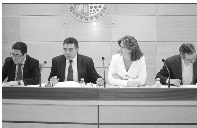
Asamblea de CIRIEC-España en la Universidad de Jaén.

CIRIEC-España celebró el pasado 10 de junio en la Universidad de Jaén su Asamblea General Ordinaria en la que, además de los puntos habituales del Orden del Día, se informó a los socios de la última hora del 27º Congreso Internacional del CIRIEC, a celebrar los días 22 a 24 de septiembre en Sevilla.