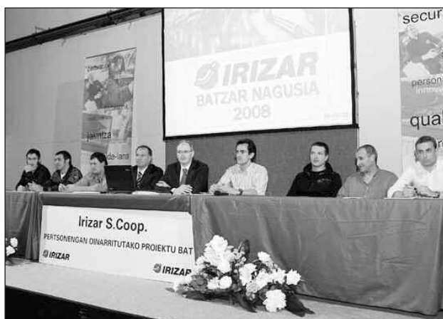
Asamblea de Irizar, del pasado mes de mayo.

Las asambleas de Ampo, cooperativa metalúrgica, y pocos días después la de Irizar, fabricante de autocares de lujo, decidieron salirse de la Corporación Mondragón, en lo que supuso una conmoción en el seno del primer grupo industrial cooperativo en Europa. No en vano se trata de los primeros abandonos de la Corporación en más de una década, abandonos que no pasan desapercibidos, ya que entre las dos empresas suman más de 600 millones de euros en facturación y 3.600 empleados.