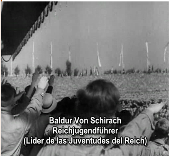
Baldur Von Schirach Reichjugendführer (Líder de las Juventudes del Reich)

Per eixa seguretat pagaran, sense dubtar-ho, un preu: la submissió cega al líder. Hi ha, a més, una equació inversa per la qual com més persones s'adherisquen al grup més fort han de ser els que rebutgen unir-se a la seua seguretat.