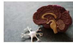
Uno de los usos más inadecuados de la hipnosis 16 noviembre, 2020