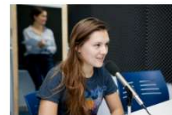
¡Hoy se celebra el Día Mundial de la Voz! 16 abril, 2020