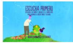
La Clínica de Psicología UV colabora con la Oficina de las Naciones Unidas contra la Droga y el Delito (UNODC) 24 noviembre, 2020