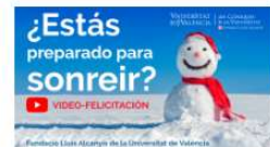
¡La Fundació os desea feliz navidad! 20 diciembre, 2019