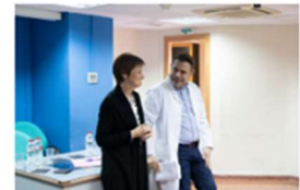
El Consejo de Dirección visita la Clínica Podológica 27 febrero, 2020