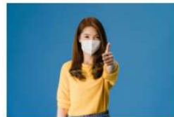
Decálogo para hacer un buen uso de la voz con la mascarilla 19 octubre, 2020