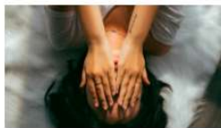
La Clínica de Psicología UV crea una guía sobre el duelo ante el impacto del COVID-19 8 abril, 2020