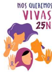
Facultat de Medicina i D'odontologia Consell d'Alumnes