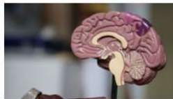
Día Mundial del Ictus: sus síntomas y rehabilitación 29 octubre, 2020