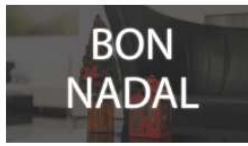
BON NADAL 18 diciembre, 2020