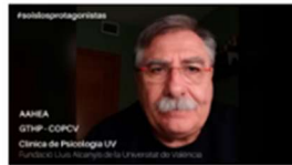
FRENANDO AL CORONAVIRUS: Ideas y sugerencias desde la Psicología #soislosprotagonistas 19 marzo, 2020