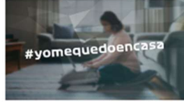
Los directores de las Clínicas UV se unen para lanzar el mensaje #QuedateEnCasa 1 abril, 2020