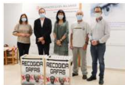
Visió Sense Fronteres recoge las gafas que se han entregado durante este año en la Fundació 8 octubre, 2020