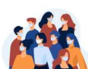
La Clínica de Logopedia de la Universitat de València da atención a pacientes Post-COVID-19 26 octubre, 2020