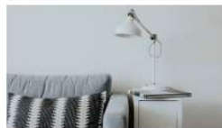
La Clínica de Psicología UV lanza la GUIA para GESTIONAR SITUACIONES FAMILIARES durante el CONFINAMIENTO 7 abril, 2020