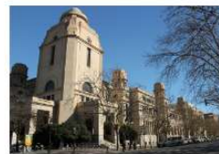
La Universitat de València se sitúa entre las mejores de España en el ranking URAP de producción científica 15 enero, 2020