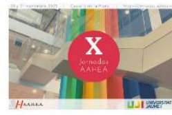
La Clínica de Psicología UV participa activamente en las X Jornades de AAHEA 14 octubre, 2020