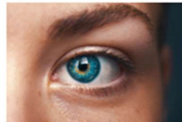
Hoy se celebra el Día Mundial del Glaucoma 12 marzo, 2020