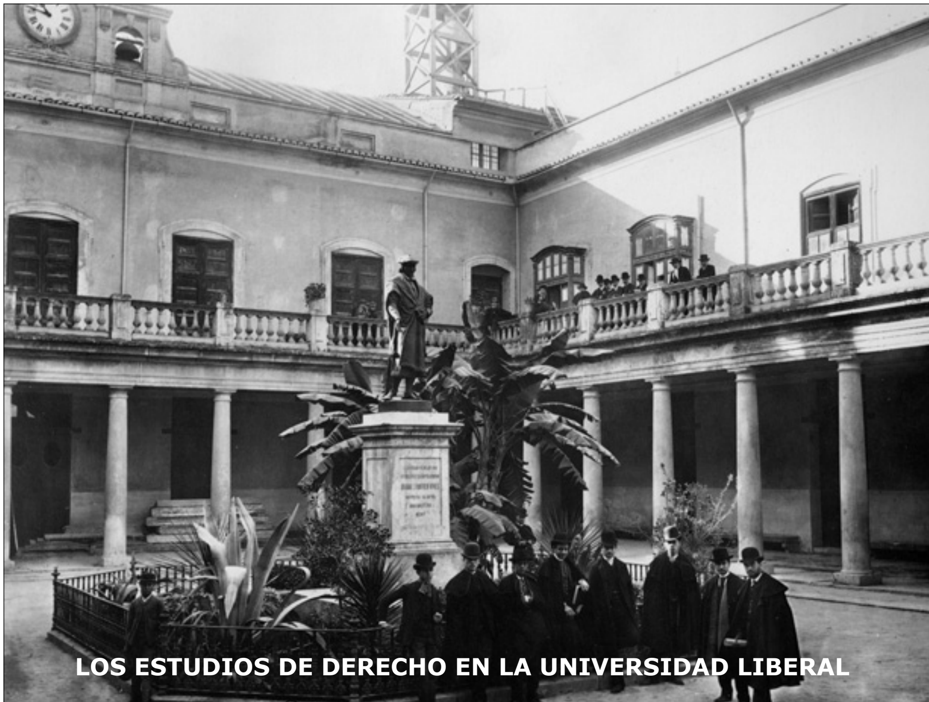
LOS ESTUDIOS DE DERECHO EN LA UNIVERSIDAD LIBERAL