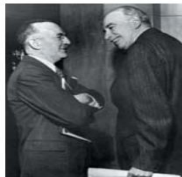
Constructores del sistema económico internacional de la posguerra: el economista del Tesoro de Estados Unidos, Harry Dexter White (izq.) saluda al economista británico John Maynard Keynes

Al tiempo que se creaba el FMI, se estableció el Banco Mundial, con el fin de fomentar el desarrollo económico a largo plazo. Mientras que el FMI se centra sobre todo en la política macroeconómica