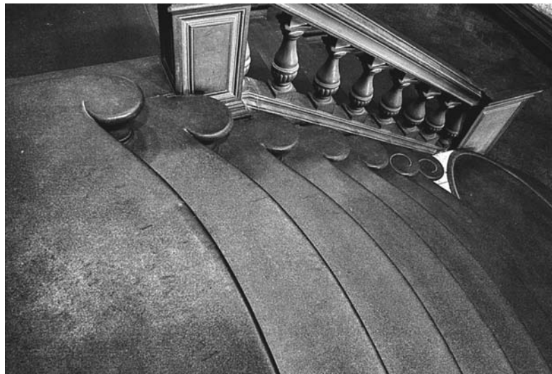
Corcheas. Vestíbulo de la Biblioteca Laurenziana, Florencia.