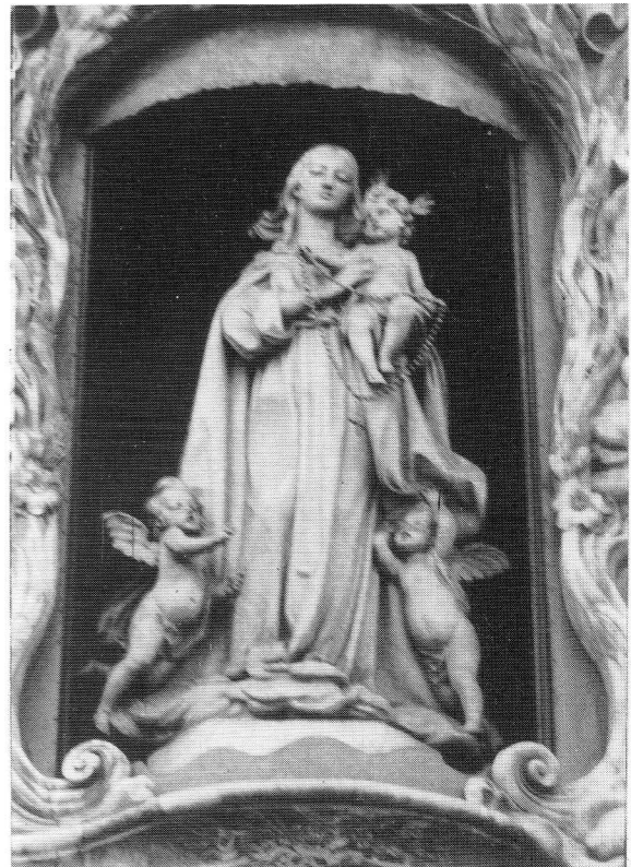
Fig. 1. F. Molinelli. La Virgen del Rosario . Palacio del Marqués de Dos Aguas.

Por todo ello, y debido a la alta calidad de su obra no es de extrañar que un notable crítico citara encomiásticamente a nuestro escultor como "el Berrugete del siglo XIX" (9).