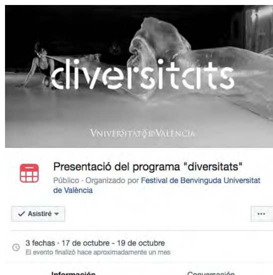
Captures de pantalla de publicacions a les diferents xarxes socials.