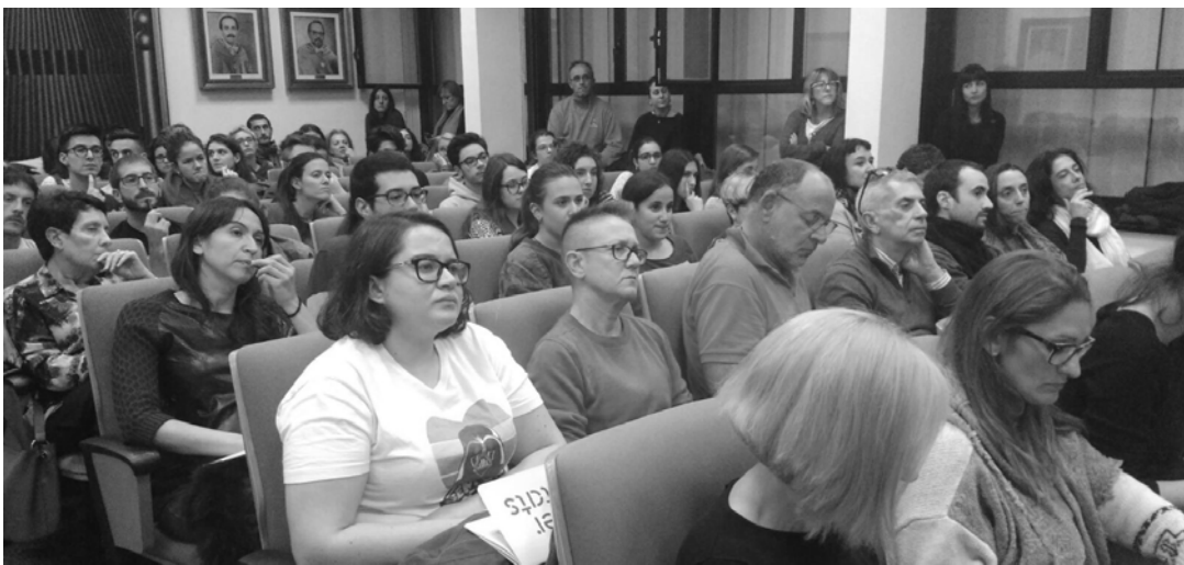
Converses als campus / 2: Experiències i activismes, diàlegs trans.