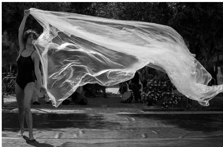
Pre-broken al Campus dels Tarongers.