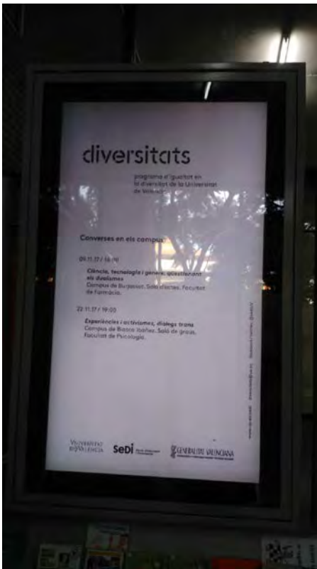
Fotografia d'un OPI genèric amb informació del cicle Converses als campus.