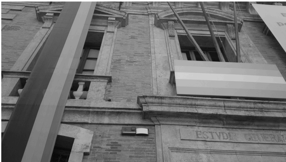
Banderoles a l'edifici del Centre Cultural La Nau.