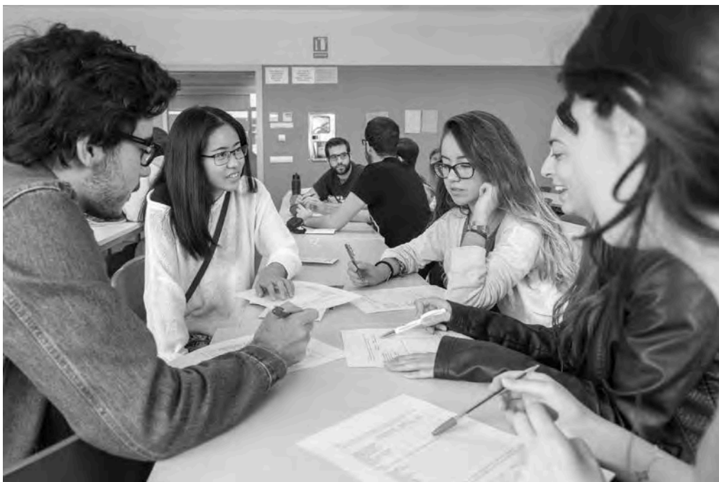
Tallers de voluntariat.