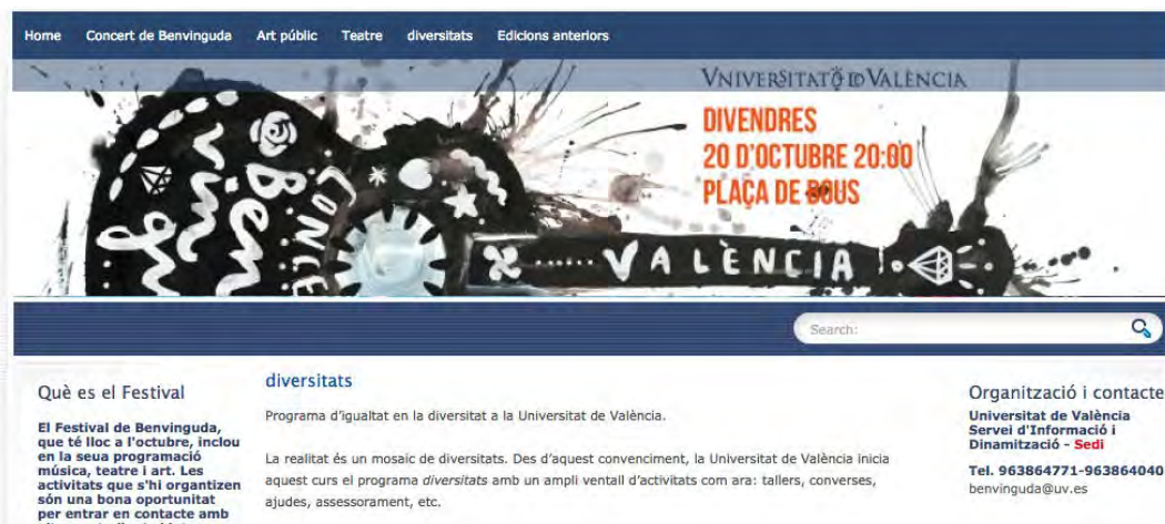
Captura de pantalla del bloc de Benvinguda.

- Al bloc del Festival de Benvinguda ( benvinguda.blogs.uv.es ), bloc allotjat al servidor d'espais bloc de la Universitat de València i dissenyat per a ser un espai de comunicació, recursos i materials per als diferents agents implicats, es va fer difusió de la presentació pública del programa, que es va realitzar en el marc d'aquest festival: