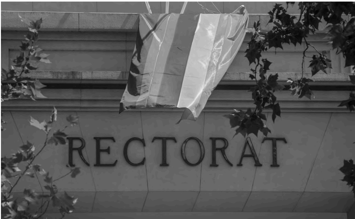
Banderoles a l'edifici de Rectorat.

Aquesta iniciativa, impulsada per la Delegació d'Estudiants de la Universitat de València i pel Sedi (Servei d'Informació i Dinamització - Universitat de València), es va fer amb motiu de la celebració del Dia Internacional de l'Orgull LGTBI el 28 de juny, data en què es commemoren els disturbis de Stonewall (Nova York, EUA) de 1969.