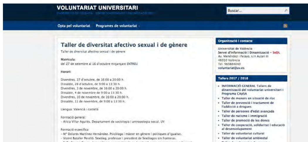
Captura de pantalla del bloc del Voluntariat Universitari.

- Al bloc del Voluntariat Universitari ( voluntariat.blogs.uv.es ), es va ver difusió del taller de diversitat afectivosexual i de gènere, que es realitzar en el marc del programa de Dinamització del Voluntariat de la Universitat de València: