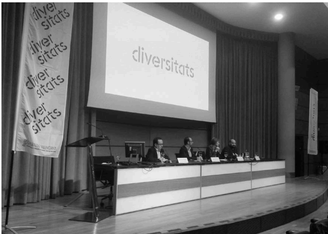
Presentació institucional del programa al Jardí Botànic.