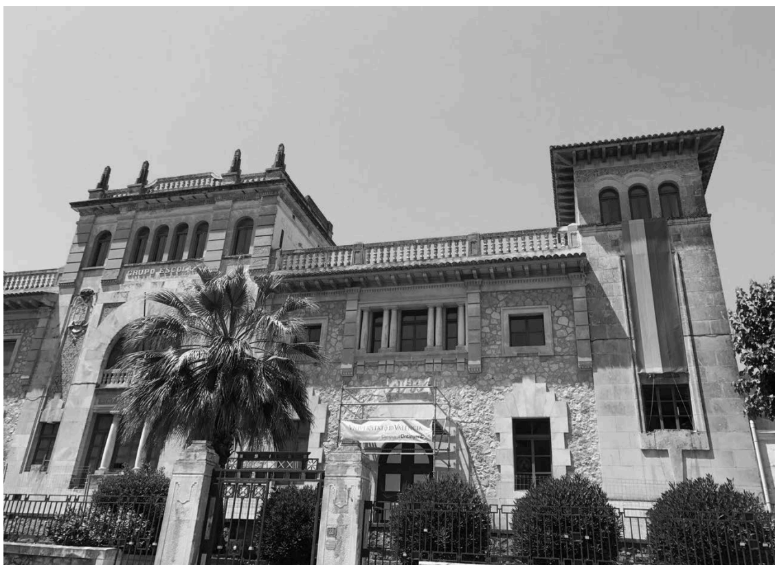
Banderoles al Campus d'Ontinyent.