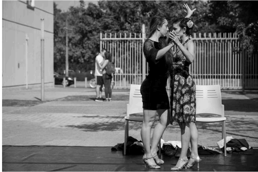
Tango queer al Campus dels Tarongers.