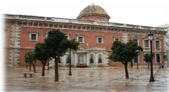
Centro Cultural La Nau

C/de la Universitat, 2. Teléfono: 96386 43 77