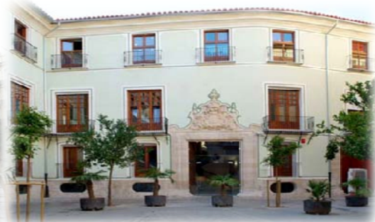
Palacio de Cerveró

C/de la Universitat, 2. Teléfono: 96386 43 77