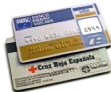
Anunci de Cruz Roja i el BBV. 1989.

Finalment, en les conclusions esbossarem possibles mancances i algunes noves línies d'investigació.