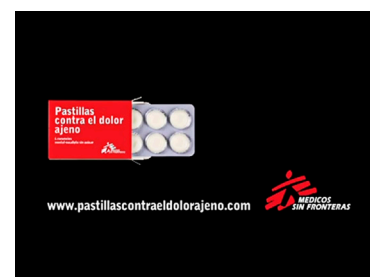
Campanya Píndoles contra el dolor alié de Médicos sin Fronteras. 2009.