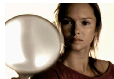
Anunci Sóc IO d'Intermón Oxfam. 2003.