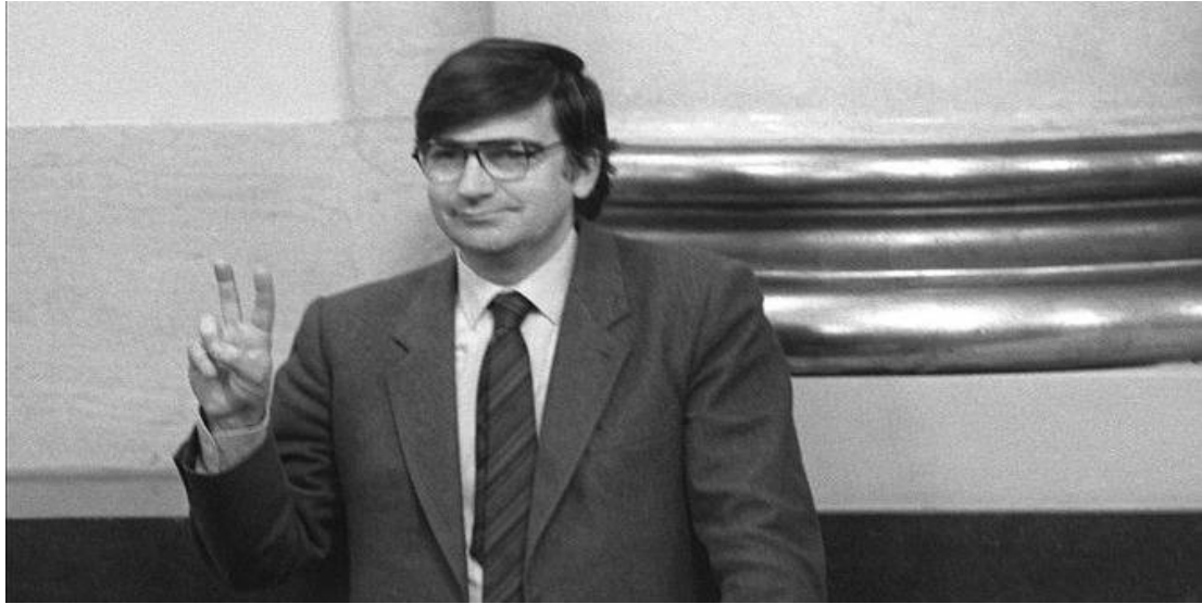
Ernest Lluch, en los años ochenta.

http://valenciaplaza.com/la-via-valenciana-un-camino-de-servidumbre