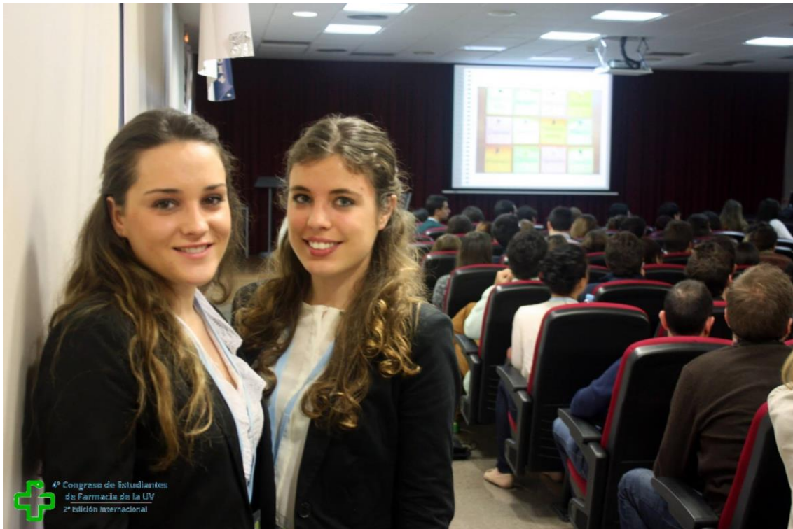
4º Congreso de Estudiantes de Farmacia de la UV 2ª Edición Internacional