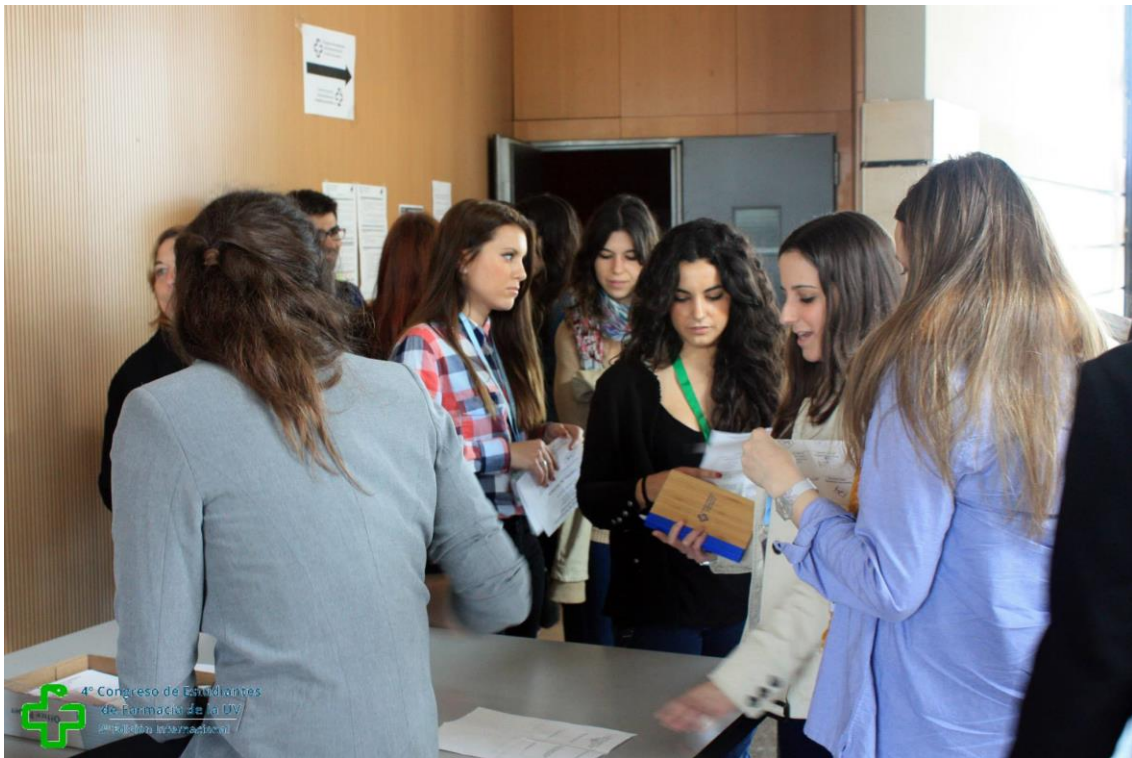
4º Congreso de Estudiantes de Farmacia de la UV 2ª Edición Internacional