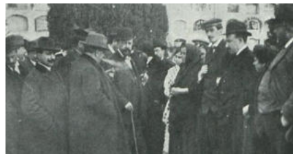
Amor de mare

Aquesta és una història molt trista. Hem d'advertir-ho, per si prefereix passar pàgina. «Recorde l'any cinquanta-sis / amb un espant que no sé dir. / He vist el rostre de la mort, / i l'he vist amargament prop.» Aquests quatre versos foren escrits per Vicent Andrés Estellés i rememoren la mort, quan només tenia tres mesos, de la seua primera filla, Isabel. Una experiència dolorosa que reapareix en diversos passatges dels seus poemaris. El dolor d'un pare o d'una mare per la mort del seu fill pot ser indescriptible. Ho acredita el cas de «Conchita».