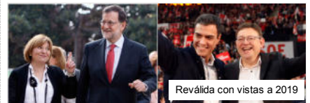
Reválida con vistas a 2019

Contenido exclusivo para suscriptores digitales