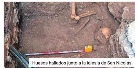
Huesos hallados junto a la iglesia de San Nicolás.

Contenido exclusivo para suscriptores digitales