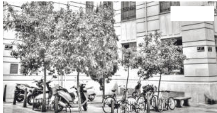
Vives. Sense casa. Sense tomba

Joan Lluís Vives va nèixer a València, cap al 1492, i va morir a Bruges (Flandes), el 6 de maig de 1540. Ni la casa natal, ni la tomba s'han conservat. Incomprensiblement, tampoc no estan senyalitzats els llocs on estaven.