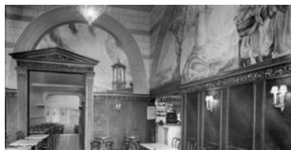
Un terrible crim inexplicat