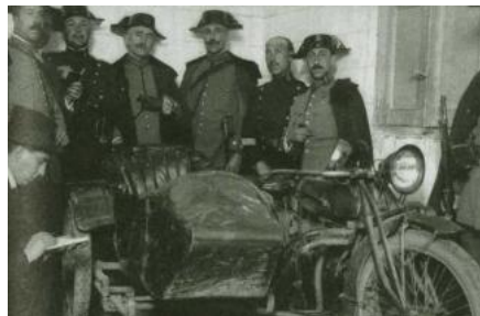
Bales contra el gobernador