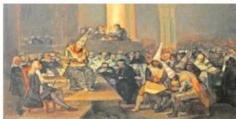
Vint-i-huit execucions i la Creu Nova