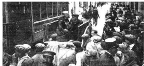
Treballadors davall dels enderroc de la fàbrica

Tragèdia al 1910. El 16 d'abril de 1910 s'enfonsà una fundició i fàbrica de bombes al Camí de Barcelona. Desenes d'obers quedaren atrapatats davall dels enderroc. Morí una treballadora de 18 anys.