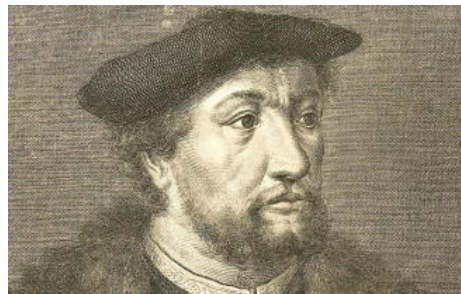
Un fulletó a la València del XVI