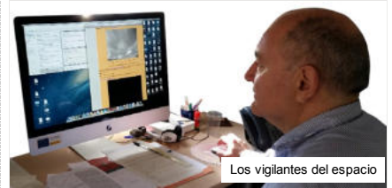
Los vigilantes del espacio

Contenido exclusivo para suscriptores digitales