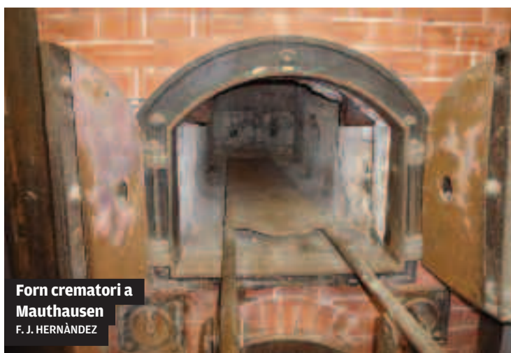
Forn crematori a Mauthausen