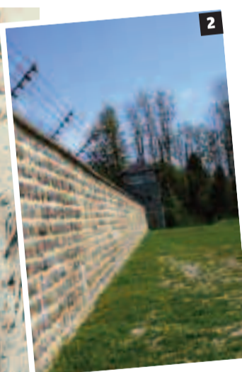
1 Rètol de l'Escala de la Mort. 2 Mur i fil-ferro del Camp de Mauthausen. F. J. HERNÁNDEZ