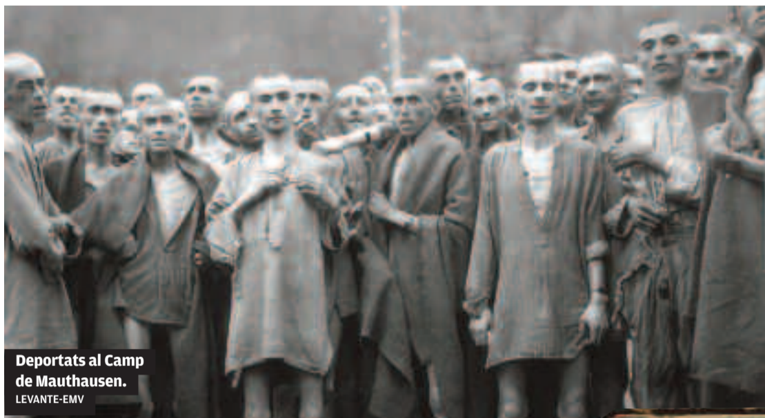
Deportats al Camp de Mauthausen.