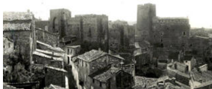
Fotografia antiga del Castell de Bunyol.

El segon comte de Bunyol fou el primer jugador de llargues de qual sabem el nom. Laudomio Mercader jugava al trinquet a la plaça de Penya-roja i torejava a cavall als prats dels dominics, a Russafa i al prat del Mercat. El 1603, Felip III creà el comtat de Bunyol per a Gaspar Mercader Carrós (1568-1631). Amb quinze anys només, Gaspar va contraure matrimoni amb Hipólita Centelles. Tingueren un fill, al qual li posaren el nom de Laudomio, probablement en record de la seua àvia, que s'anomenà Laudomia. Laudomio fou poeta, pilotaire i torero. Certament donà raó del lema de l'escut de la família: «No te falta res»