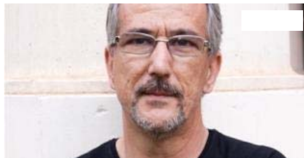
Montañas mirando. Sólo «patencia»