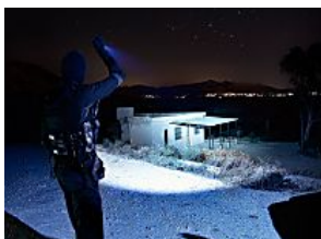
Esta Linterna Táctica Está Creando no Pocas Polémicas en España useful4real.com