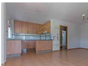
Casas en venta en Valencia por menos de 90.000 euros