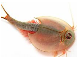
Retiran 1.247 juguetes en Canarias por contener una especie invasora