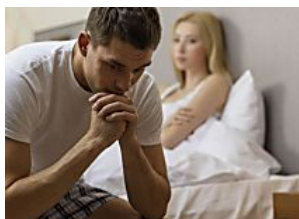
Cómo afrontar la eyaculación retardada en pareja DMedicina