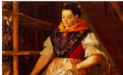
El rocambolesc viatge de la seda