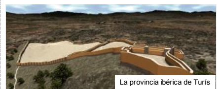
La provincia ibérica de Turis

Contenido exclusivo para suscriptores digitales