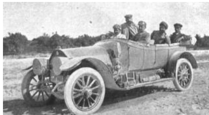
Arribar a Barcelona més ràpidament que el tren?