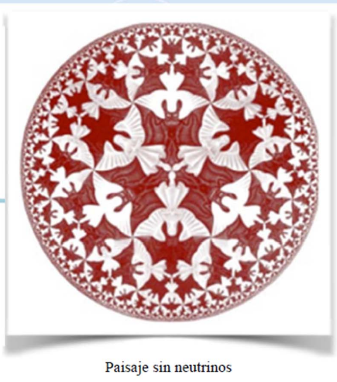
Paisaje sin neutrinos