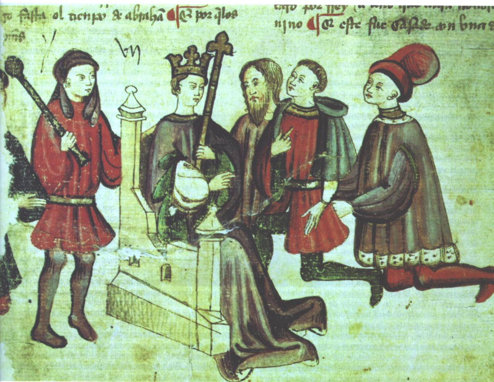
Libro de los Castigos del Rey don Sancho.

suponían para la economía del país, así como la opinión negativa que los extranjeros pudieran formarse de los españoles.