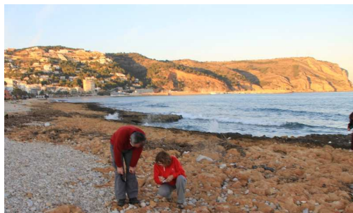
Detall d'una visita al Montgó

La matrícula de les activitats complementàries, englobades amb el títol La Nau Gran en obert presentava enguany un augment d'oferta ben remarcable. Com a resum de la matrícula de les activitats a realitzar durant el primer trimestre del curs 12-13 podem destacar