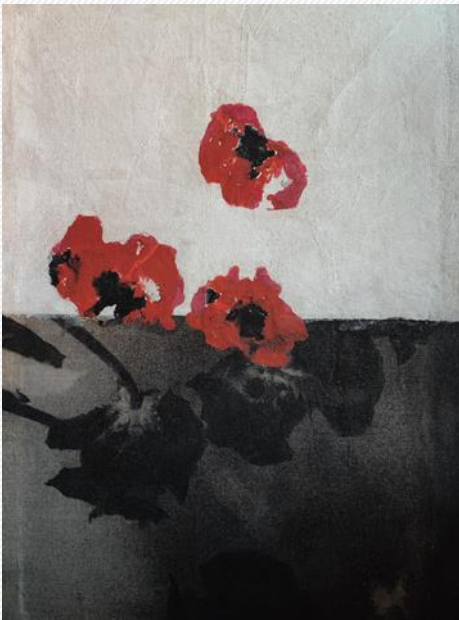
TÉCNICA MIXTA SOBRE LIENZO 80 X 60