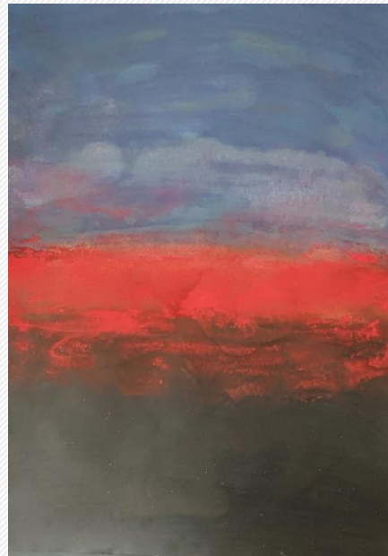
ACRÍLICO SOBRE PAPEL 50X70