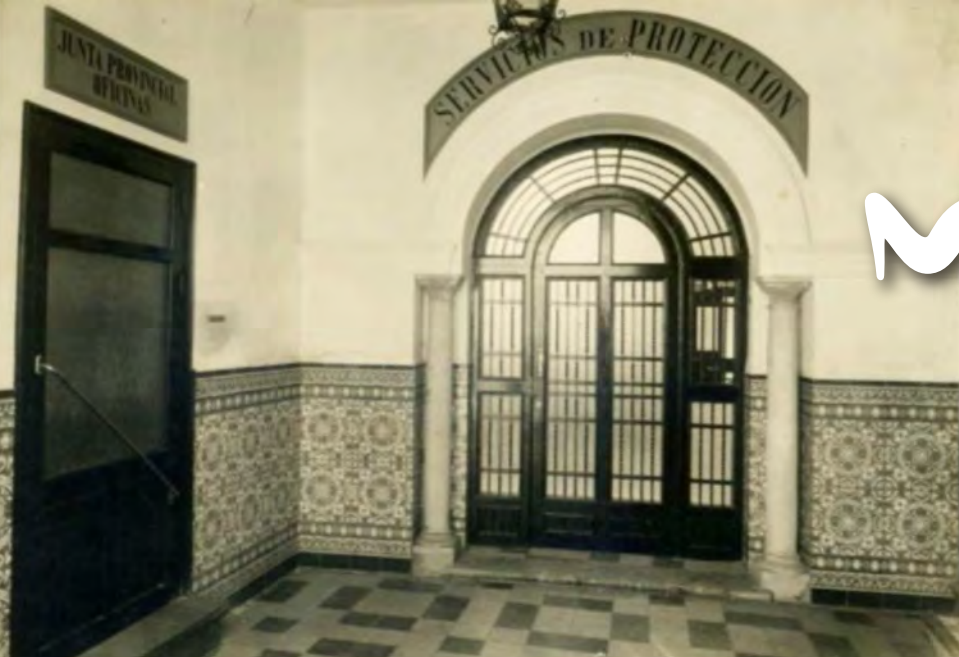
Entrada del Centro de Observación y Clasificación de Sevilla.