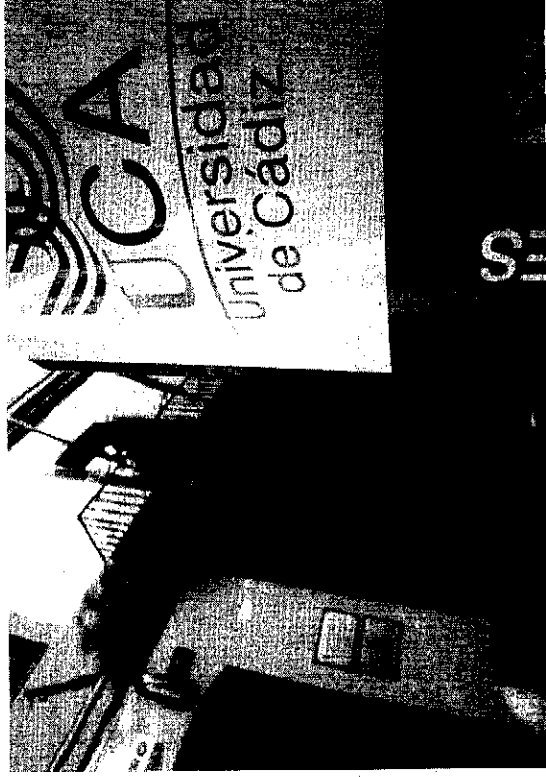
El Campus universitario de Cádiz por ahora no tendrá 'minipisos' para los jóvenes estudiantes.

Estos minipisos que se construirán en breve en Jerez acogerán a un solo alumno por vivienda por un plazo máximo de cinco años en régimen de alquiler. Esta solución será transitoria y el estudiante arrendatario no pagará más de 200 euros.