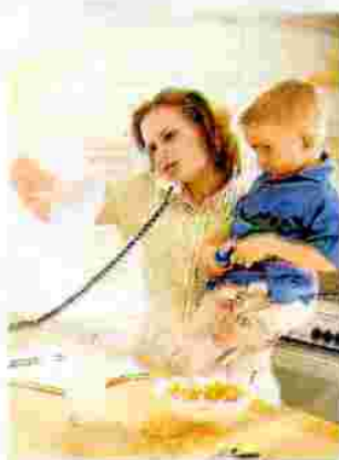
La mujer intenta conciliar.

En el caso de los hombres no se da la misma relación y de hecho, los que más tiempo dedican a los trabajos no remunerados son los licenciados universitarios, aunque con una distancia insignificante frente a los que no han pasado por el colegio.