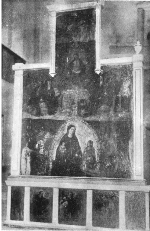
El retaule del Judici Final i el cavaller de Colònia de la Torre de Canals abans de la Guerra d'Espanya, quan encara conservava la predel·la. Mestre de Xàtiva-Artés-Borbotó.