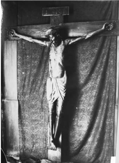
Crist gòtic del Calvari Alt, desaparegut en la Guerra d'Espanya.

tres: estima, treball i modernitat. Algunes de les pintures que s'hi recullen foren destruïdes en la Guerra d'Espanya però la major part encara podem admirar-les. 6 Gràcies a Elies Tormo coneixem fins i tot les mides i detalls del que ja no tenim. La ciutat era per a l'autor un Museu de primitius, on cada església, cada ermita, conformava una sala en la qual es podia gaudir de l'art pictòric medieval. Aquells escrits que tenen un segle són responsables en gran part de l'interès i la passió que molts historiadors de l'Art valencià hem mostrat des d'aleshores per la pintura sobre taula.