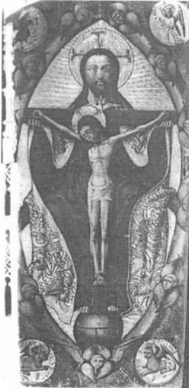
Trinitat desapareguda de la Seu Mestre de Xàtiva-Artés-Borbotó

valencianes, com per exemple la taula de sant Lluís d'Anjou al museu de Bordeus, obra del Mestre de Xàtiva-Artés-Borbotó.