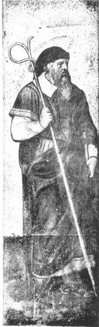
Sant Joaquim. Vicent Macip i Comes Taula desapareguda del Calvari Alt

Pel que fa al retaule major de l'ermita de les Santes, ara al Museu de l'Almodí, pintat per encàrrec dels agustins després de 1515, cal recordar que el Mestre de Xàtiva-Artés-Borbotó anteriorment havia pintat també el retaule dels