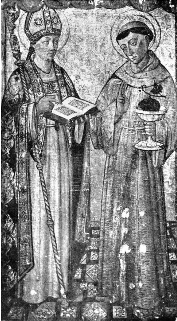
Taula de sant Eloi i sant Antoni de Pàdua (Nicolau Falcó) Fot. d'E. Cardona publicada per L. de Saralegui en El Maestro de Sta. Ana y su escuela