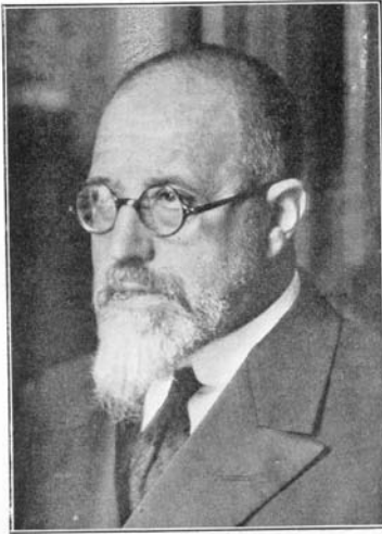
Elies Tormo i Monzó

l'activitat acadèmica amb la política en ser diputat el 1903. A partir de 1907 obtingué l'acta de senador per la Societat Econòmica de València en diverses legislatures. El 1919 fou vicepresident del Senat i el 1930 ministre d'Instrucció pública i Belles Arts durant la "dictablanda" del general Berenguer, un any abans de la caiguda de la monarquia alfonsina. Durant l'any que ocupà el ministeri declarà monument històric-artístic l'església de Sant Feliu i les restes arqueològiques islàmiques del palau dels Sanç de Vallés a Xàtiva. Al consell de ministres s'oposà a l'execució dels