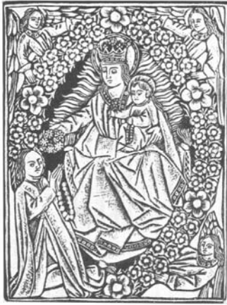
Maria coronant amb les roses de l'Ave Maria el Cavaller de Colònia. Gravat imprès a Montserrat

escultòric de la Lamentació, conegut com “la Pietat dels escalons”, ha permès que l’obra recuperés l’aspecte original daurat, i que ens trobem davant una obra excepcional dins del patrimoni artístic valencià. 27 També ha estat una sorpresa l’aparició del donant en la taula de Santa Úrsula, repintat fins ara com si fos una de les onze verges. 28 La taula de la Magdalena 29 pintada per Joan Reixach també ha canviat d’aspecte després de la restauració. Ara podem admirar el rostre original de la santa i els cabells cenyits al coll com ja advertirem l’any 2002. 30